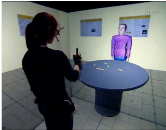
Mensch und Max können Sprache und Gestik verwenden