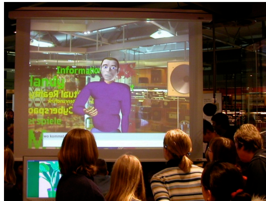
Max im Nixdorf-Museum

Jetzt möchte ich darüber berichten, wie sich Max als Museumsführer macht. Seit Januar 2004 arbeitet er im Heinz Nixdorf MuseumsForum in Paderborn. Das HNF ist nicht nur ein aufbewahrendes Museum, sondern man will dort auch zeigen, wie die Technik der Zukunft aussehen könnte. Dort ist Max zugleich ein Exponat, an dem man sich vorstellen kann, so wird vielleicht unsere Zukunft, und gleichzeitig ein Museumsführer, denn er erklärt dort auch die Ausstellungsstücke in der Ausstellung für künstliche Intelligenz und Robotik. Oder er erklärt den Computerpionier Heinz Nixdorf, oder sich selbst: „Max, das bin ich. Ich bin eine künstliche Person, die sprechen und gestikulieren kann. Ich selber bin künstlich, kann mich aber genauso ausdrücken wie du.“ Im Paderborner Heinz-Nixdorf-Museum hat also die Zukunft der Kommunikation schon begonnen mit dem künstlichen Museumsführer Max.